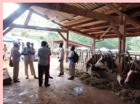
Le Réseau Rural a participé à deux journées de transfert des résultats de la recherche et de l'expérimentation organisées par le RITA et à destination des agriculteurs : la 1 ère Journée de végétal à la station agronomique de Dombeni, le 24 sept (photo du haut) et la 4 e Journée de l'Élevage sur l'exploitation du lycée de Coconi, le 29 oct (ci-dessus).