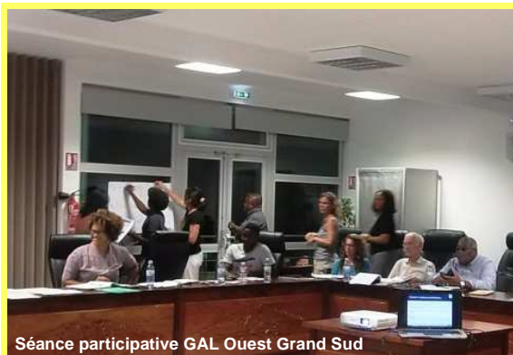
Séance participative GAL Ouest Grand Sud

La concertation des acteurs, au travers d'une démarche participative est au cœur des projets européens présentés dans ce numéro.